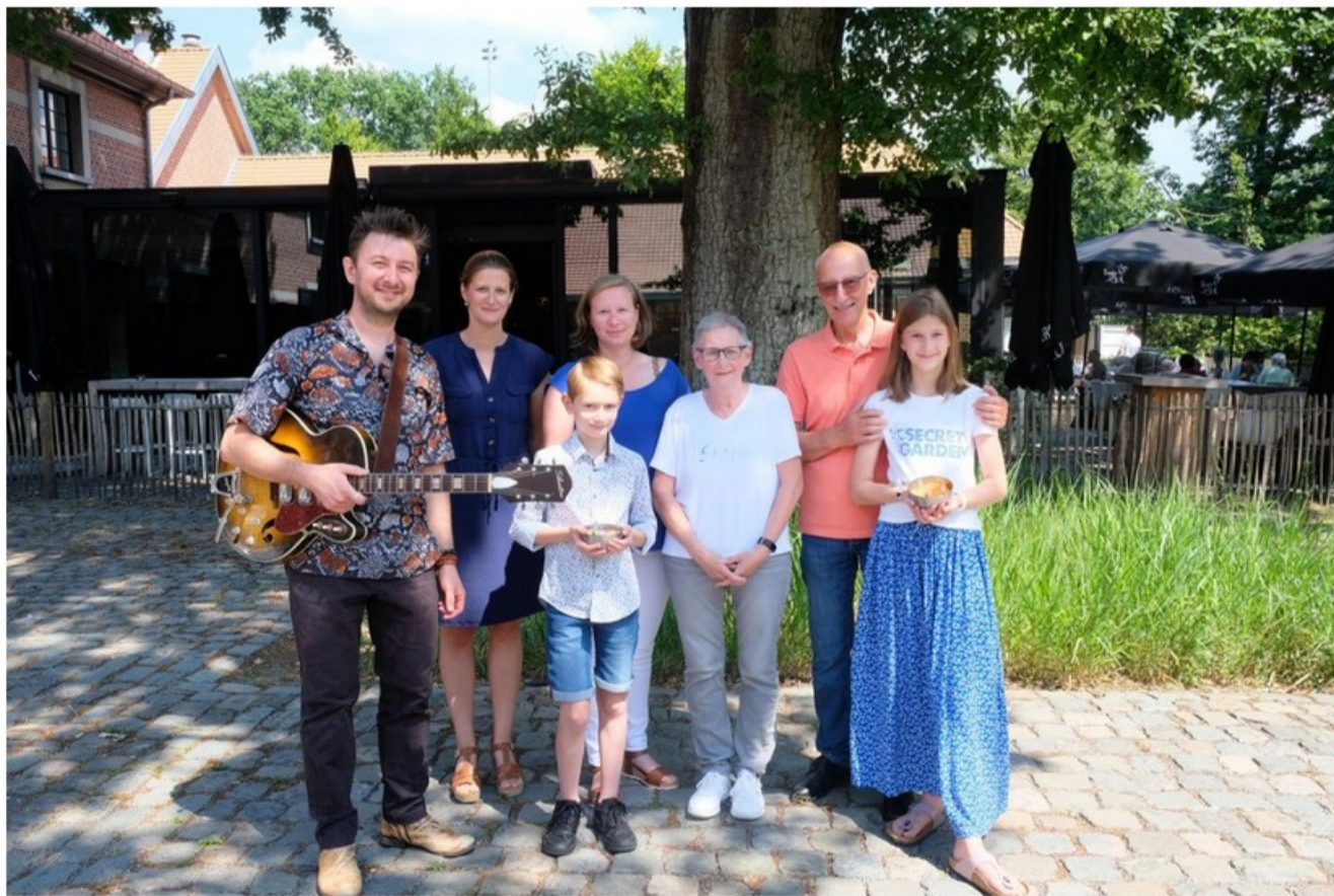
Onan met de nazaten van de Flor.

“Maar Flor stond vooral bekend vanwege zijn talloze grappen. We zijn die beginnen te verzamelen en hebben ze in een tekst gegoten. Zo mochten de bezoekende kinderen zelf hun snoepjes uitkiezen, maar ze moesten daarbij wel blijven fluiten. Zo was hij er zeker van dat ze geen snoepjes in hun mond zouden steken. Het lied staat bol van dergelijke anekdotes. Zo was er een vrouw die na afloop van haar eigen trouwfeest in haar trouwkleed nog snoep kwam kopen bij de Flor. ‘Pak nog een snoepje voor onderweg’, zei hij ook vaak. Talloze Brasschatenaren kwamen geregeld in zijn winkel om er daarna telkens opnieuw weer goedgezind naar buiten te gaan. Flor maakte op hoge leeftijd ook nog de overgang van de frank naar de euro mee. Materiaal genoeg dus voor een lied. Ik heb het eerst aan de nazaten van Flor laten horen en zij reageerden heel enthousiast. Zo heeft het zijn uiteindelijke vorm gekregen.”