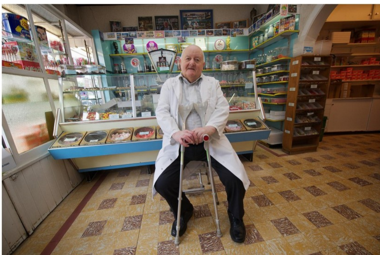
De Floor zoals heel Brasschaat hem heeft gekend.

Volgens Onan zijn er redenen genoeg om over Flor een lied uit te brengen. De geliefde man hield bijvoorbeeld gedurende 67 jaar een snoepwinkel open in het centrum van de gemeente.